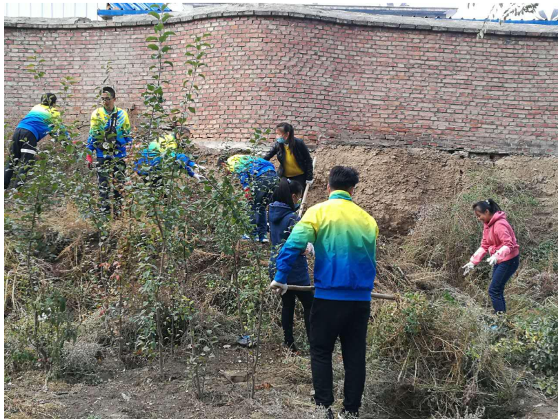
图三 同学们在清除杂草