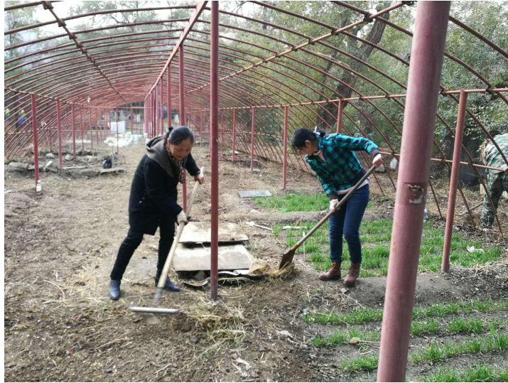
图一 带队老师带头清理网室