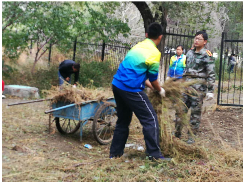
图四 同学们对收集杂草杂物进行转运